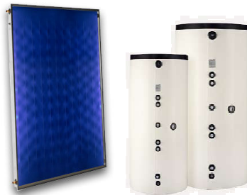
Figura 1 – Sistema de Circulação Forçada

Não obstante, é uma solução mais cara e de instalação mais complexa, que necessita de uma bomba circuladora e controlador para funcionar.