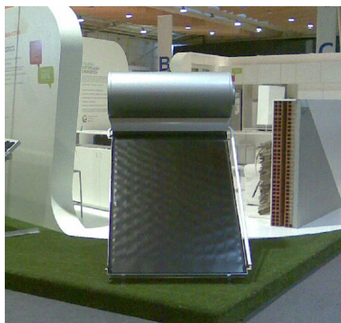
Figura 2 – Sistema de Termossifão

É uma solução económica e de fácil instalação, uma vez que todos os seus componentes (colectores e acumulador) se encontram no telhado, ligando-se facilmente ao sistema de água, normalmente através da chaminé. O seu funcionamento baseia-se no princípio de circulação natural por gravidade não necessitando de circulador nem de sistema de regulação.